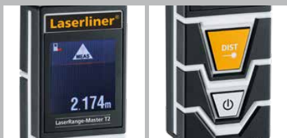
Pantalla LC en color con iluminación

* Véase precisiones específicas por sectores en el manual de instrucciones.